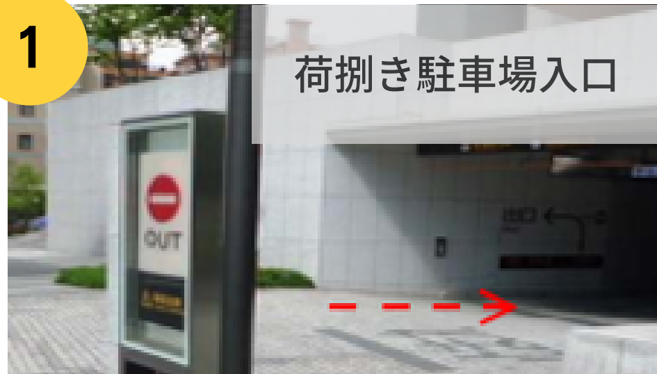
荷捌き駐車場入口