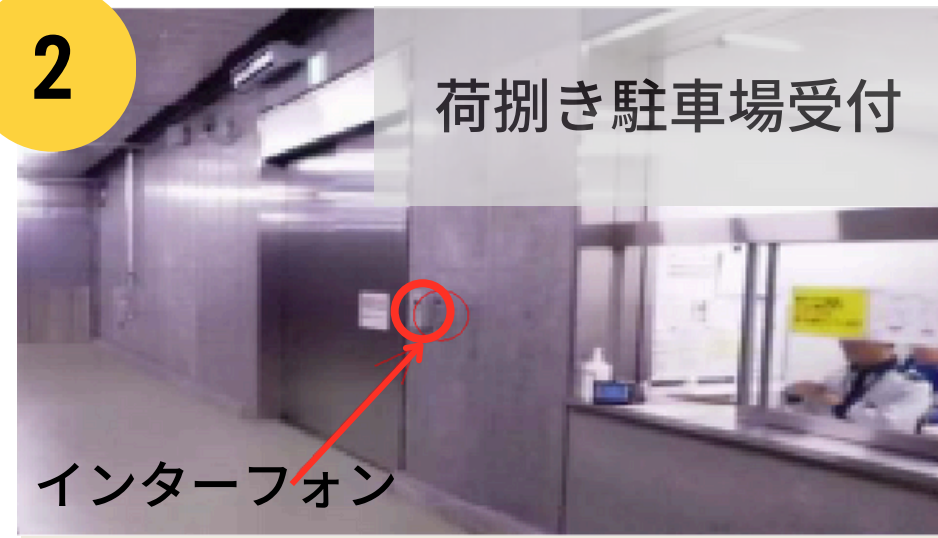
荷捌き駐車場受付